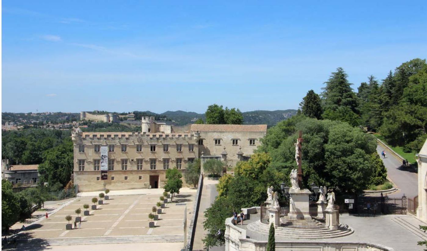
Livrée cardinalice du «Petit Palais»