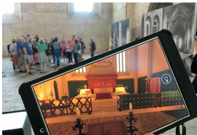
Histopad © F. Olliver