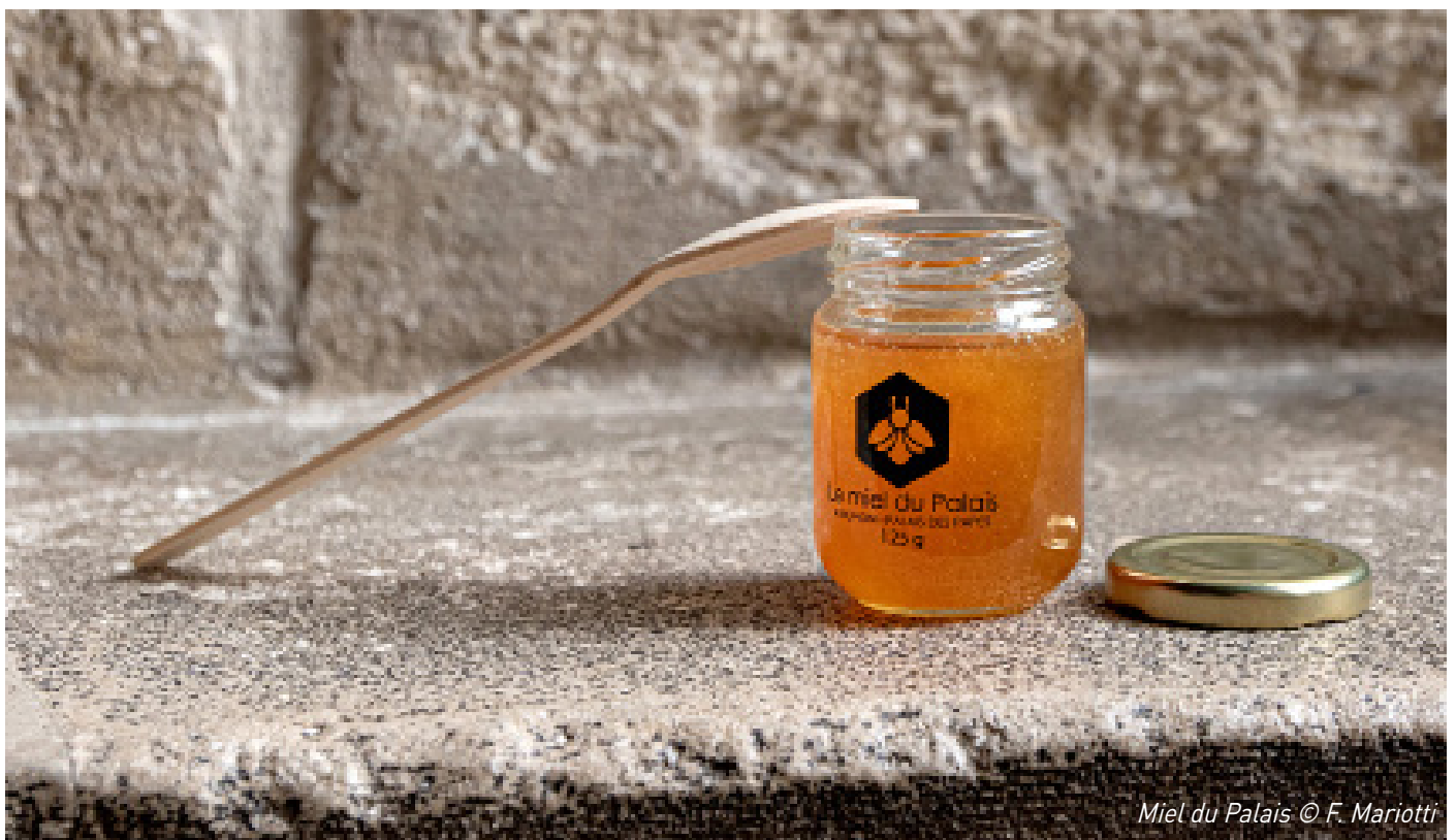
Miel du Palais

Le projet s'inscrit dans le programme de développement durable et biodiversité de la Ville.