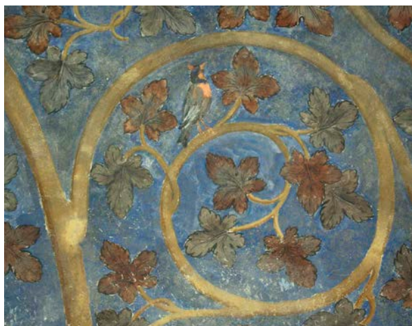
Chambre du Pape - Décor peint

Clément VI attache également une attention particulière à l'embellissement des jardins que Benoît XII a déjà implantés et bordés de remparts. Ce réaménagement conduit à la définition spatiale d'un nouveau jardin dont la partie la plus réorganisée est celle aux pieds des appartements pontificaux, avec la construction d'une maison pourvue d'une galerie et l'ajout d'une grande fontaine, « Griffon », entourée d'une prairie fleurie et dont l'accès est rendu direct au Pape par un escalier en vis depuis ses appartements privés.