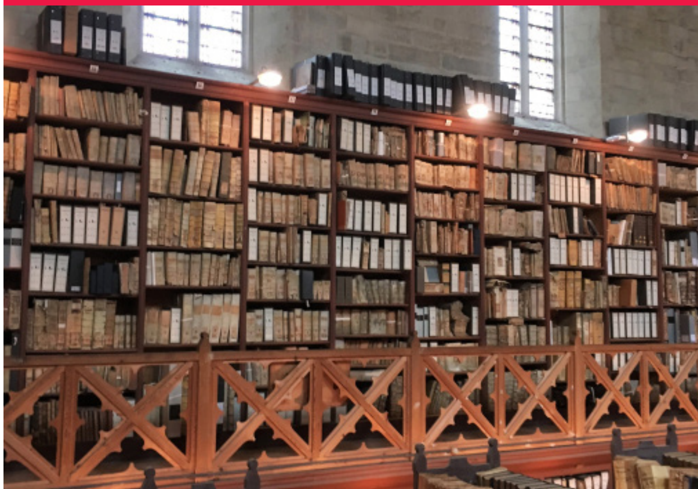
Archives départementales au Palais des Papes