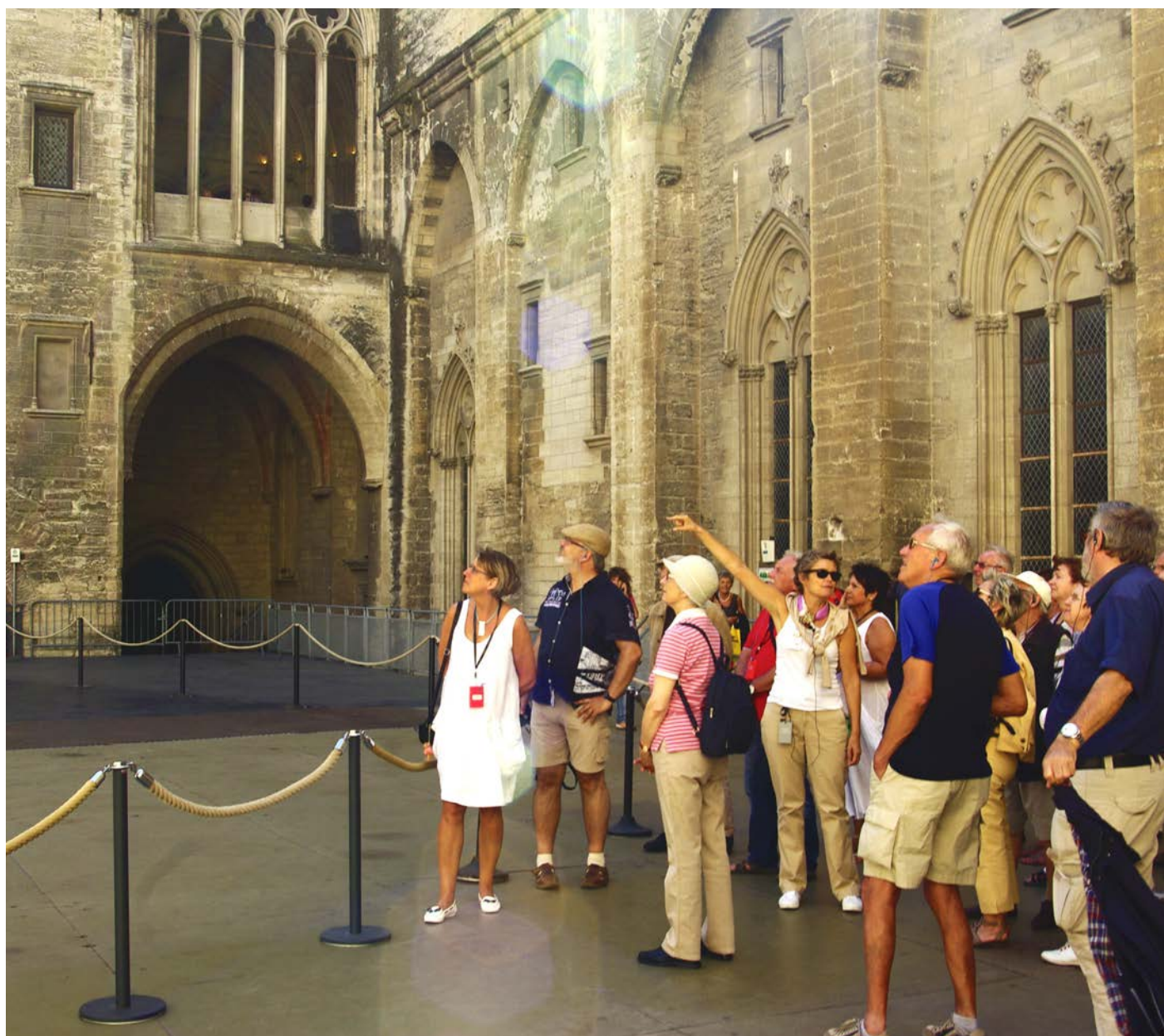
Visite guidée