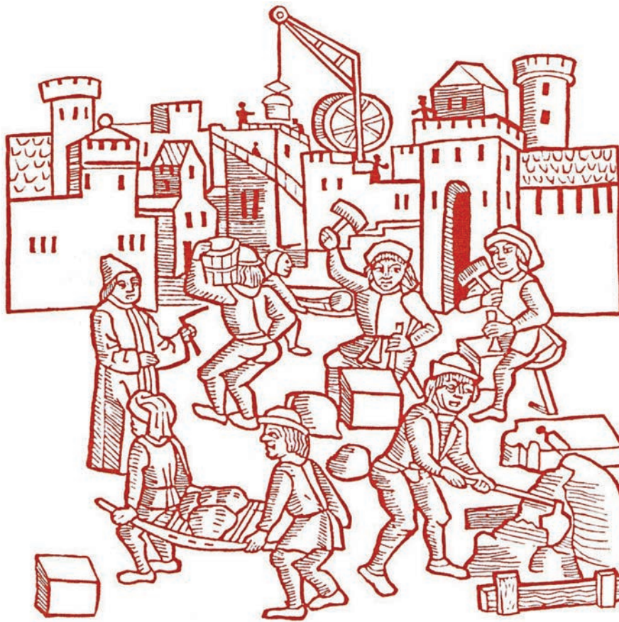
Construction du Palais