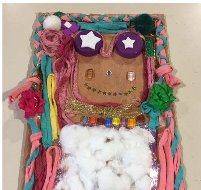
Ateliers pédagogiques