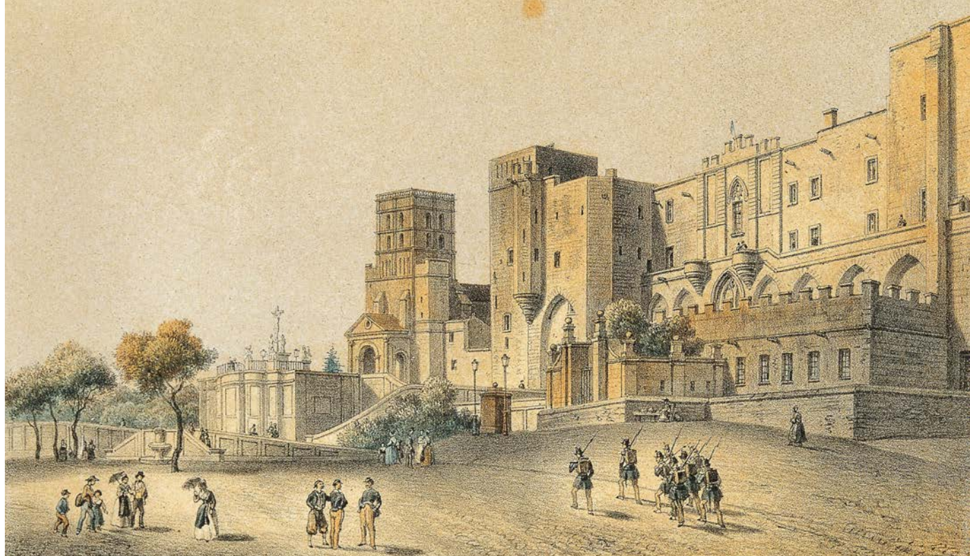
Présence militaire