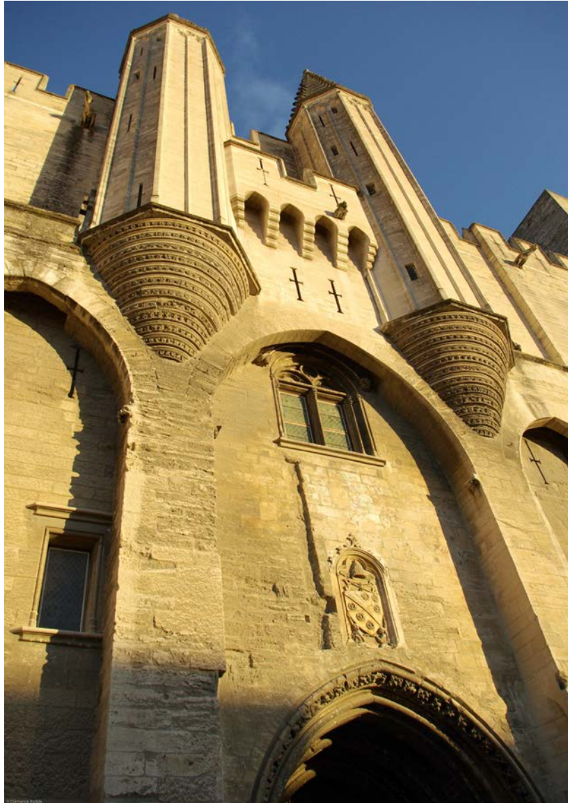
Tours Champeaux

A partir de 1907, les campagnes de restauration vont débiter sous la conduite de l'architecte des Monuments Historiques, Henri Nodet . Durant tout le XXe siècle, le Palais des Papes va connaître des grands chantiers de restauration, ils se poursuivent également jusqu'à aujourd'hui permettant de transmettre ce patrimoine aux générations futures et de s'ouvrir de plus en plus au regard des visiteurs pour devenir aujourd'hui l'un des monuments les plus visités de France .