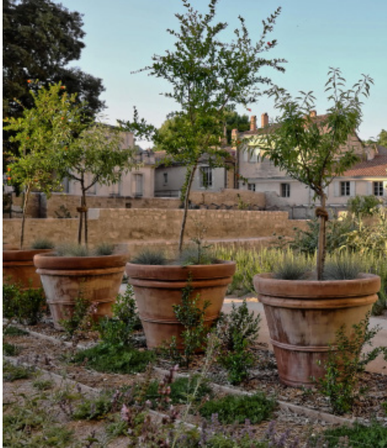
Les jardins du Palais