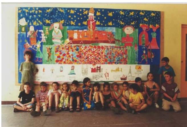
Ateliers pédagogiques