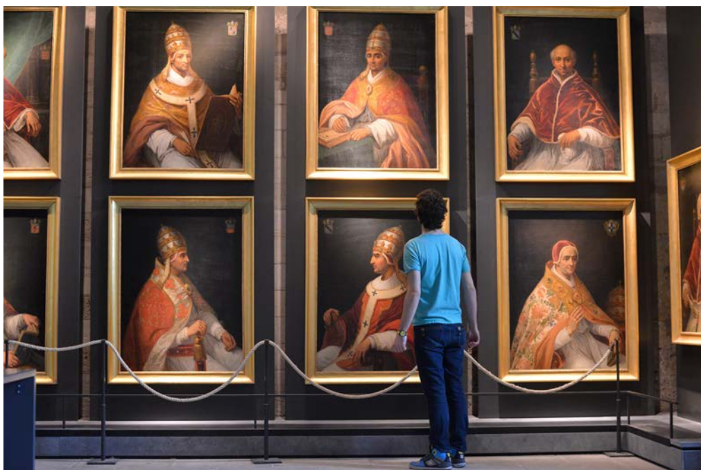
Les Papes

La physionomie architecturale du palais n'évolue que de manière sporadique durant les pontificats des successeurs d'Urbain V. Grégoire XI, Clément VII et Benoît XIII , s'ils résidèrent bien de manière pérenne au Palais des Papes engagèrent des travaux d'entretiens, d'aménagements succincts mais aucune construction d'ampleur ne sera entamée, trop occupés sans doute à leur volonté de voir à nouveau le Saint-Siège revenir à Rome ou à asseoir leur légitimité dans le contexte du Grand Schisme d'Occident (1378 - 1417)