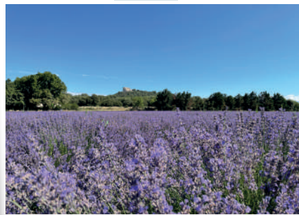
Champs de lavande