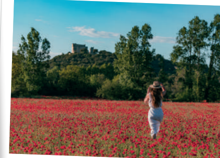
Colline de Thouzon