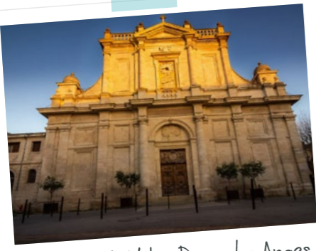
La Collégiale Notre Dame des Anges