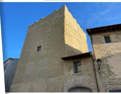
The Tour d'Argent