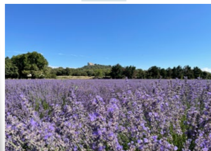
Champs de lavande